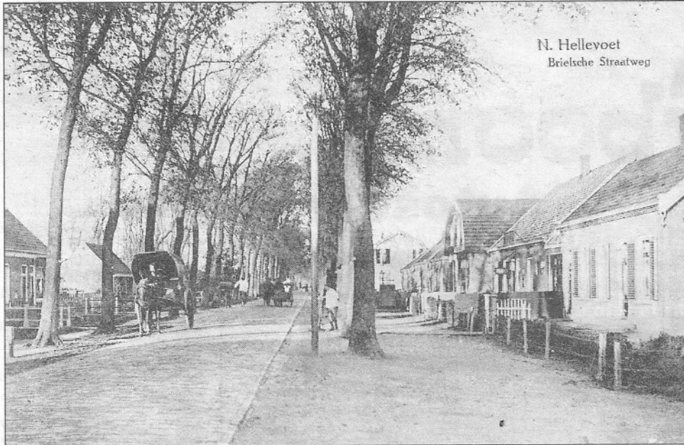
N. Helleyoet Brielse Straatweg