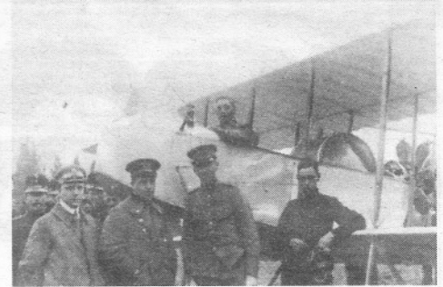
Piloot Versteegh met zijn Farman tweedekker, augustus 1915.

een uur of drie is het euvel hersteld en kan het luchtruim weer worden gekozen (zie foto).